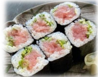
Negi Toro Roll