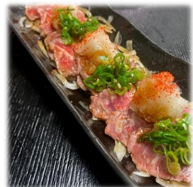
Beef Tataki Salad

Beef Tataki Onion Salad* ..... 12 ショートリブのたたきオニオンサラダ