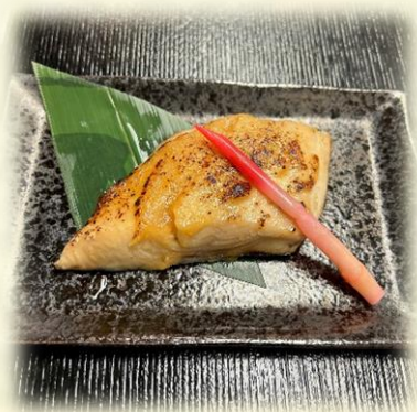
Miso Butter Fish