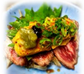
Short Rib & Sea Urchin