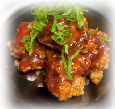
Ume Shiso Karaage Chicken