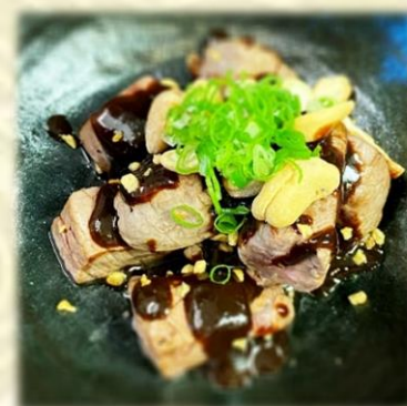
Beef Filet Diced Miso Steak