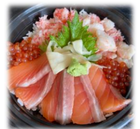
Salmon Ikura and Crab Don