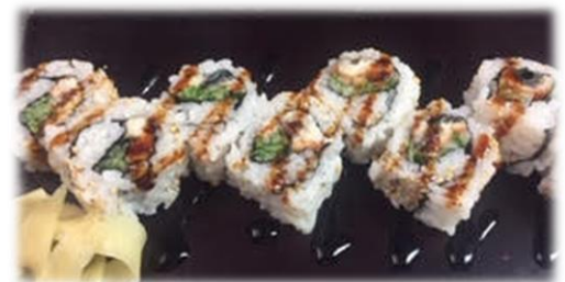
Unagi Cucumber Roll