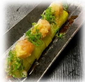
Eggplant w/ Grated Daikon Ponzu