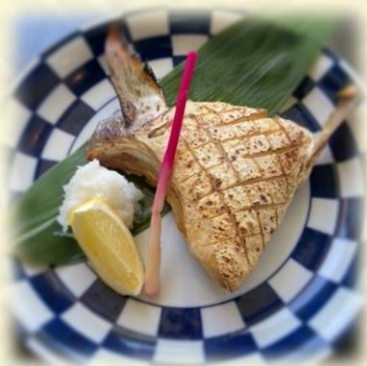
Grilled Hamachi Kama