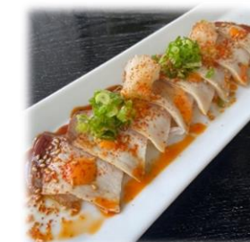
Spicy Hamachi Tataki