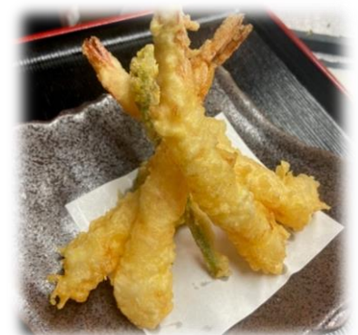
Shrimp and Veg Tempura