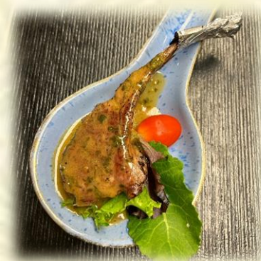
Lamb Chop Basil Sauce