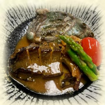
Abalone Butter with Asparagus