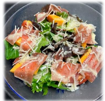
Prosciutto Papaya Salad

Prosciutto and Papaya Salad..... 10.50 生ハムとパパイアのサラダ