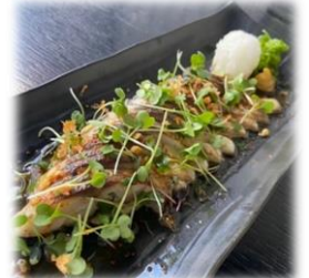
Aburi Shime Saba