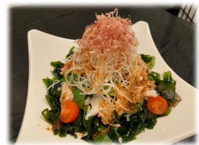
AKIRA'S Crab Salad

AKIRAサラダ 和風ドレッシング (Greens, Daikon Tomato, Wakame)