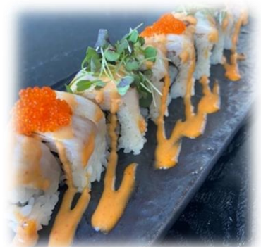
Spicy Hamachi Roll