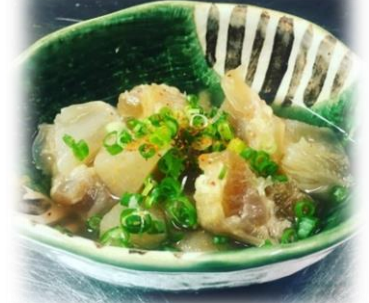
Daikon and Beef Tendon