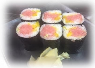
Toro Taku Roll