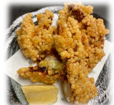
Soft Shell Crab w/ Arare