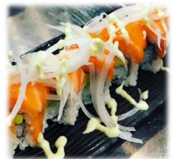
Salmon Avocado Roll