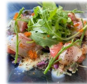
Tai Snapper Grapefruit Carpaccio